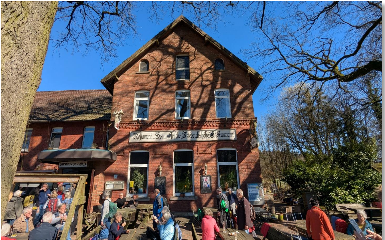
Bergweltenweg mit Einkehr März 2025