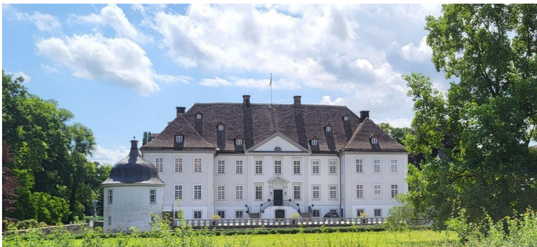
Schloss Vitsebeck im Juni 2025