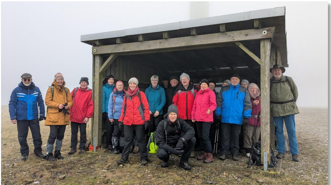
Im Februar 2025 auf dem Kleeberg im Nebel