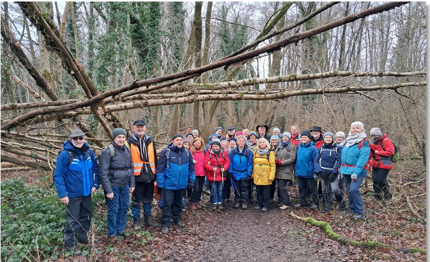
Stiefelvergabe & Grünkohl Januar 2025