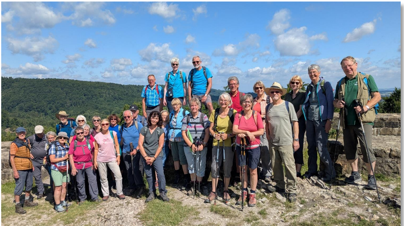
Auf der Falkenburg im Juni 2025