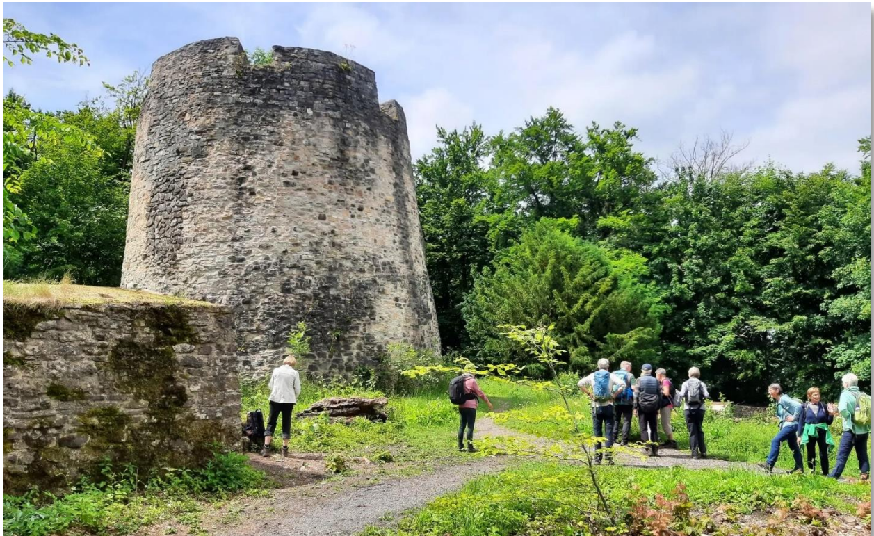
Bergfried der Ruine Iburg bei Bad Driburg Mai 2025