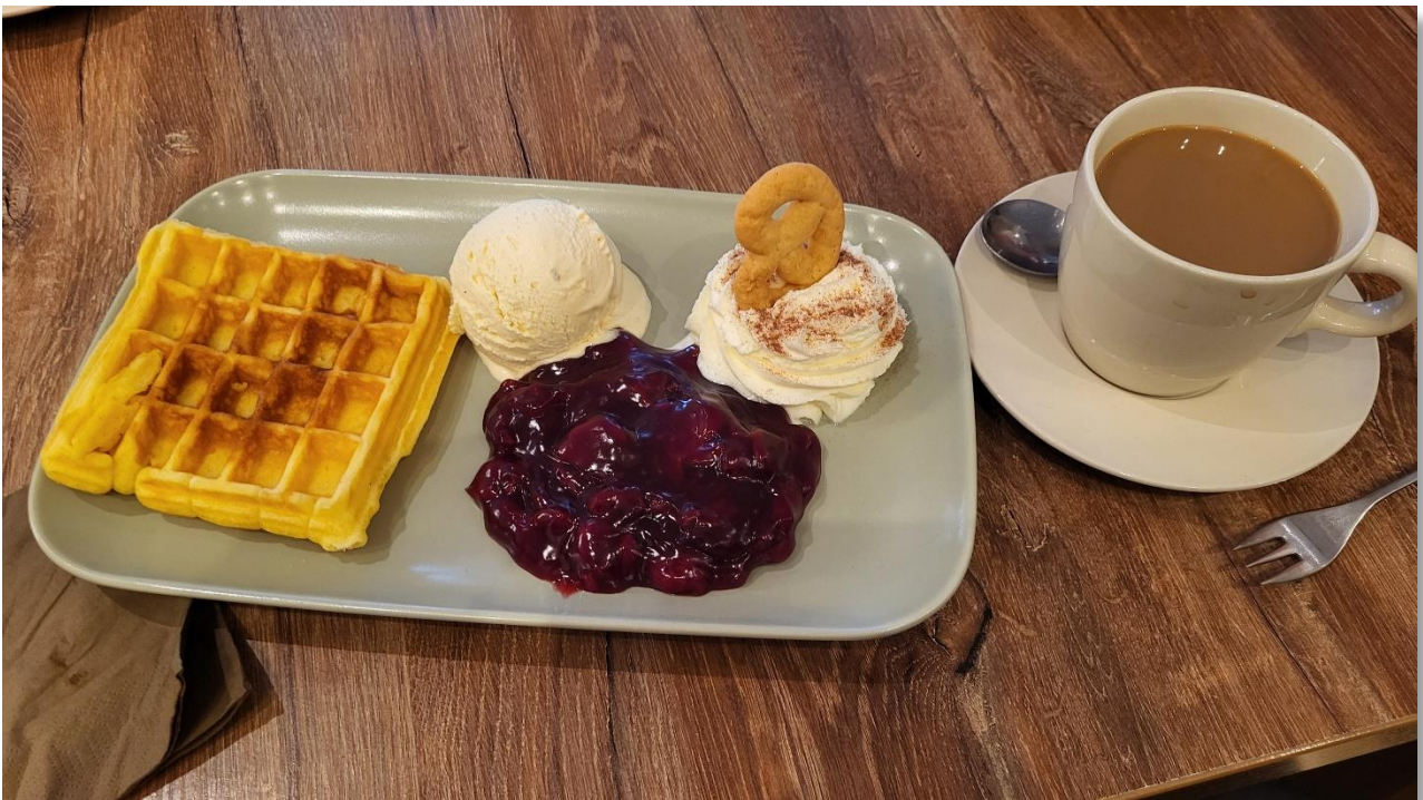
Waffelwiedergutmachung an einem frischen Februartag 2025