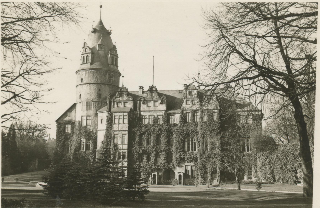
Das Detmolder Schloss um 1925. Titelbild: Kaiser-Wilhelm-Denkmal in Porta Westfalica

Alle Infos unter www.twv-lippe-detmold.de